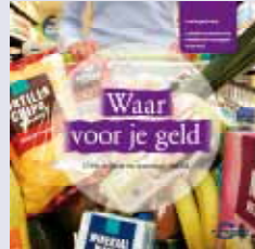
'Waar voor je geld' praktische lesopdrachten tweede fase havo/vwo