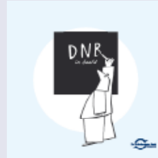
'DNB in beeld'