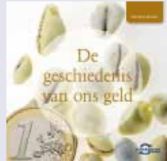
'De geschiedenis van ons geld'