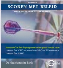
'Scoren met beleid' digitaal lesprogramma tweede fase havo/vwo

Onder meer de volgende uitgaven van de Nederlandsche Bank zijn verkrijgbaar: