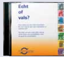
'Echt of vals?' cd-rom met de echt- heidskenmerken van de eurobiljetten