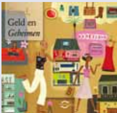
'Goud, Geld en Geheimen' publieksbrochure